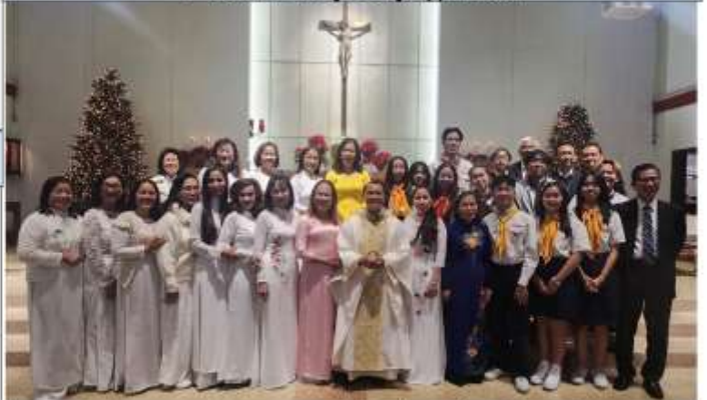
NGHI THỨC SAI ĐI CỦA BAN THỪA TÁC VIÊN LỜI CHÚA 1-7-2024